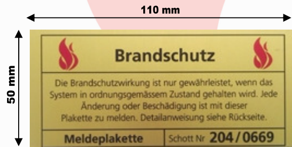
Brandschutz Meldeplakette Aluminium eloxiert