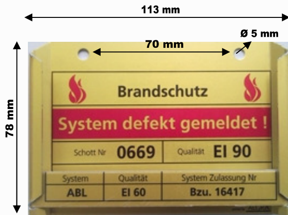
Einschiebehalter Aluminium eloxiert